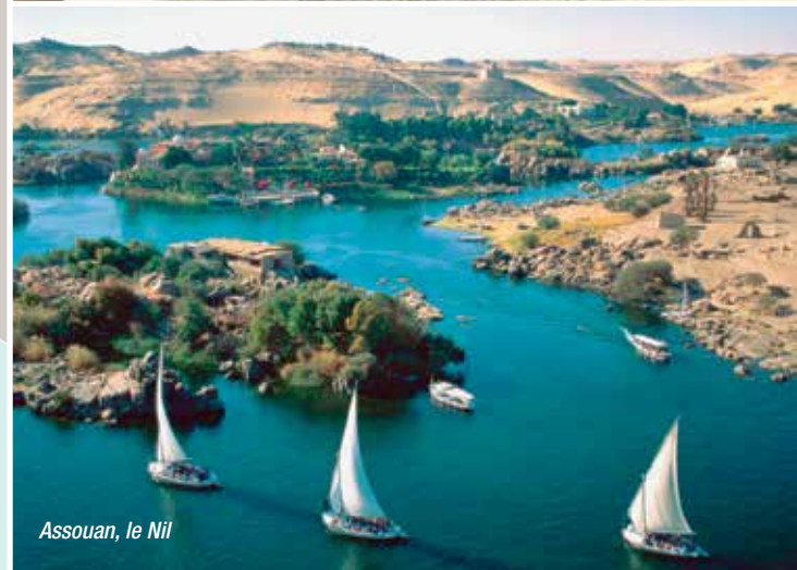
Assouan, le Nil