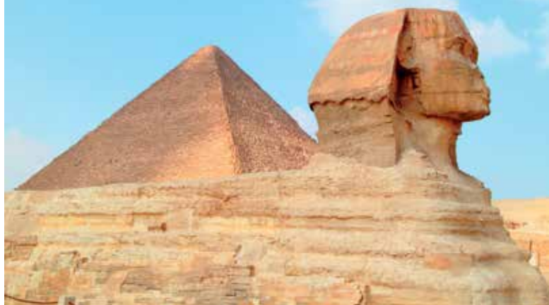
Gizeh, le sphinx