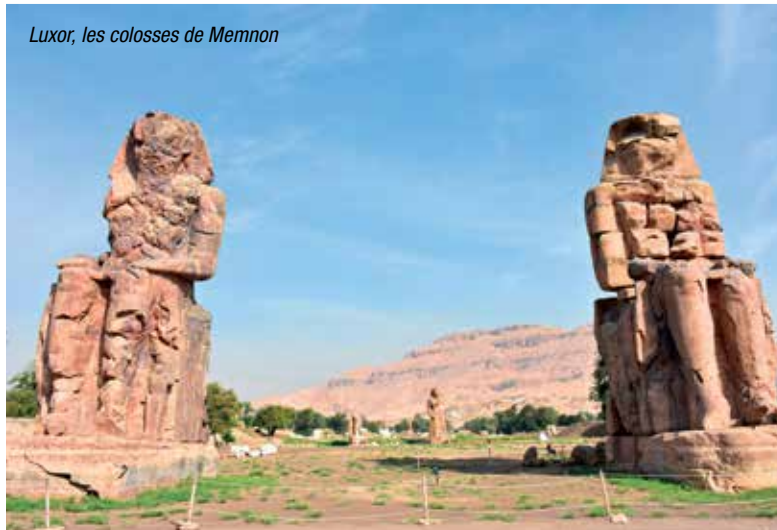
Luxor, les colosses de Memnon