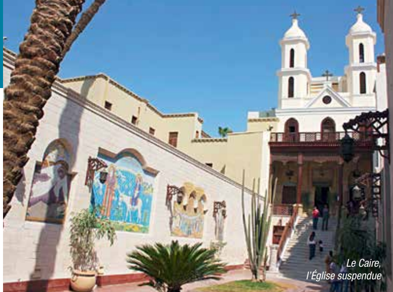
Le Caire, l'Église suspendue