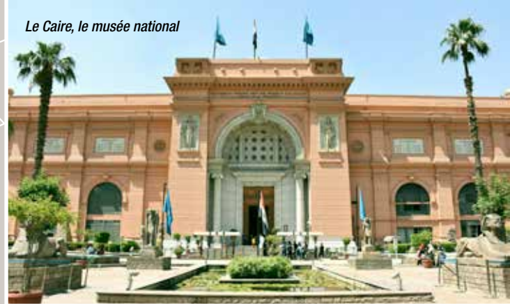
Le Caire, le musée national